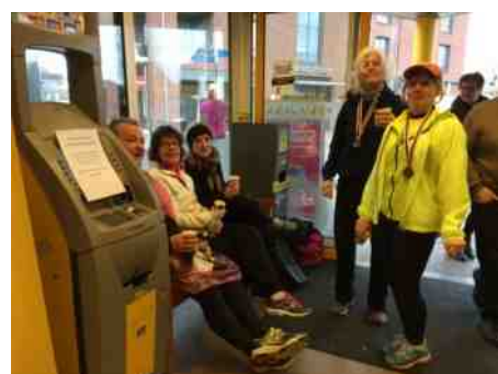
ROADRUNNERS BIJ DE JUMBO (KROEG WAS HELAAS GESLOTEN)