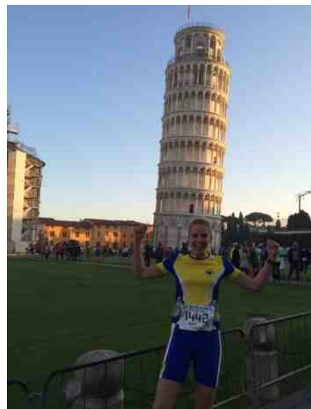
ROADRUNNER IN ITALIE