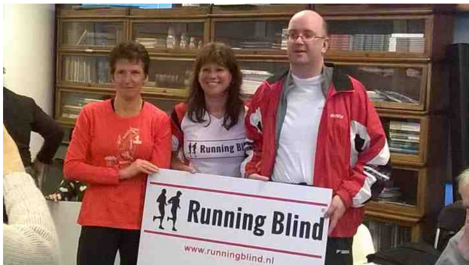
RUNNING BLIND LEIDEN 1JAAR