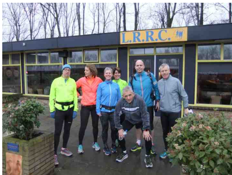
TRAINEN VOOR DE MARATHON