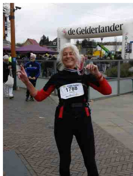
ROADRUNNER IN MONTFERLAND